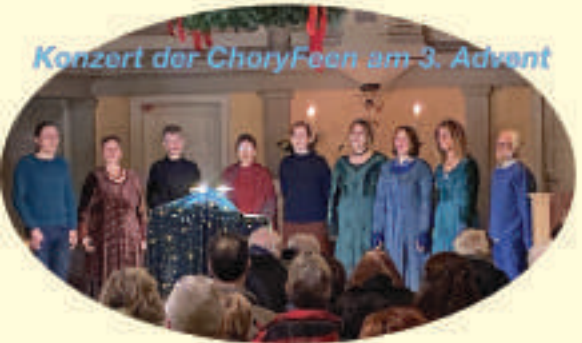
Konzert der ChoryFeen am 3. Advent