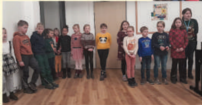
Der Nikolaus besucht den Kinderchor am 2. Advent