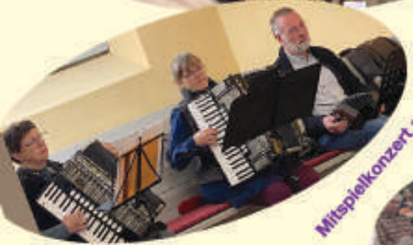
Mitspielkonzert am 1. Advent