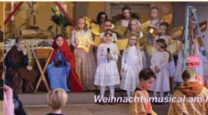
Weihnachtsmusical am Hl. Abend