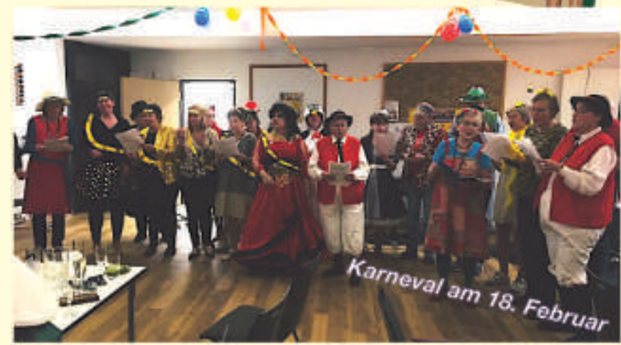
Karneval am 18. Februar