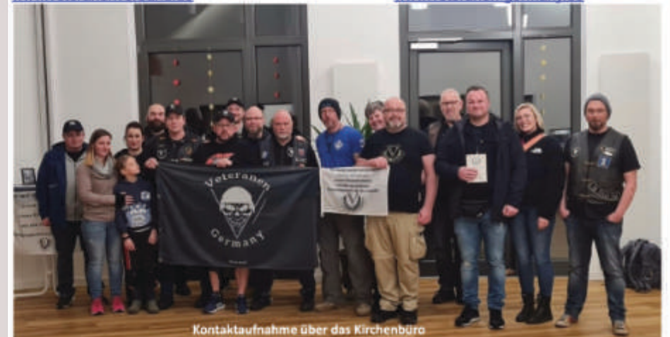
Kontaktaufnahme über das Kirchenbüro