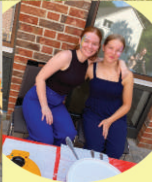
1. Sommerreise - Gottesdienst am 9.7.