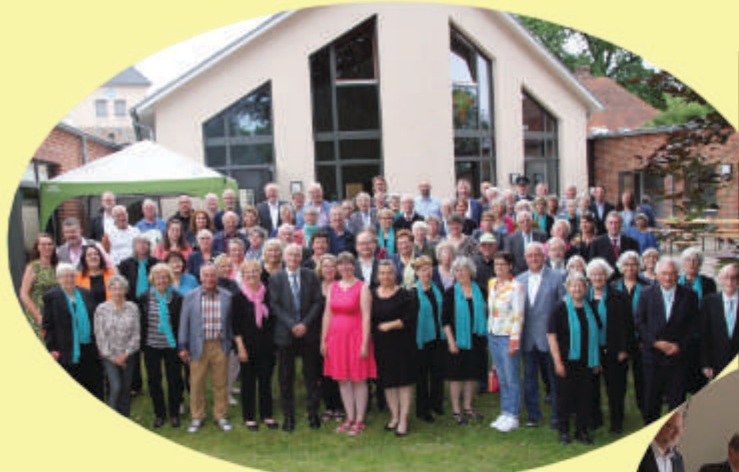
Abschied von unserer Pastorin am 1. Juli