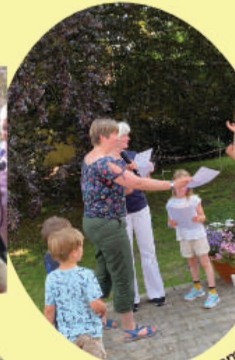
Sommerfest am 25.6.