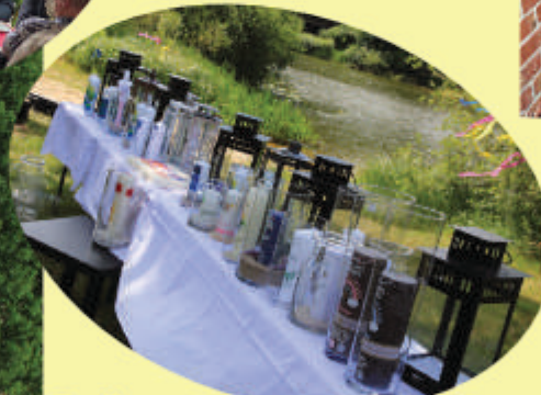
Taufest an „Alten Leine“ am 2.7.